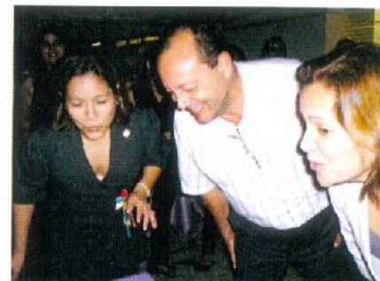
Parabéns pelos 09 anos!