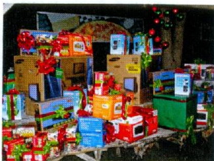
Mesa de Presentes

No dia 11 de Dezembro, a Festa de Confraternização da Química Real no Restaurante Parrillero foi repleta de alegria, presentes, música e muita dança! E ainda contamos com a presença das consultoras técnicas e da equipe da filial de Ribeirão Preto, que vieram de São Paulo especialmente para participar da festa!