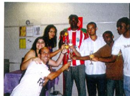
Um brinde à Química Real