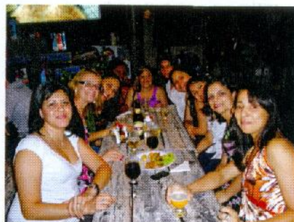
Equipe Química Real