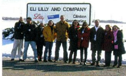
Equipe em visita à Fábrica da Eli Lilly

A viagem foi encerrada com um inesquecível passeio à Disney World, premiação oferecida pela Química Real à equipe técnica pelo excelente desempenho no ano de 2008.