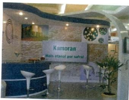
Stand da Química Real

Nossa equipe técnica, também presente no stand, demonstrou grande preparo e conhecimento na elaboração dos trabalhos técnicos distribuídos no evento, e no atendimento diferenciado aos vários clientes que nos prestigiaram visitando nosso stand.