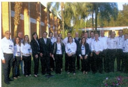
Equipes técnica e comercial da Química Real